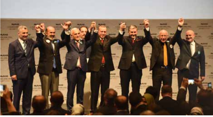
Erdoğan, patronlarla elele

İş Kanunu'nun tüm prosedürü takip edilerek gerçekleştirilmeye çalışılan bir dizi yasal grev, OHAL'e dayanılarak "ulusal güvenlik" gerekçesiyle iptal edildi.