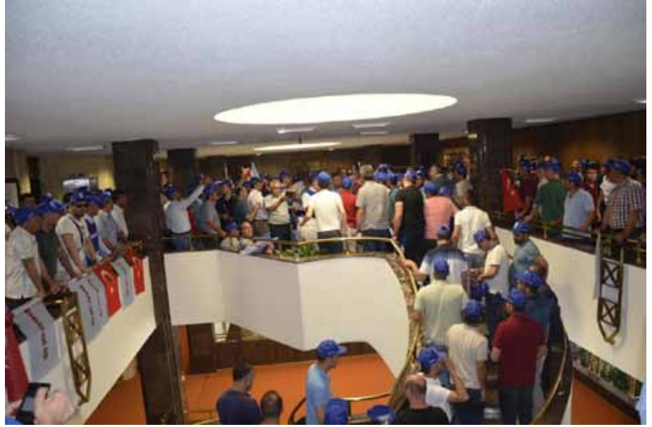
Petrol-İş üyesi işçiler TP Genel Müdürlüğü'nü "işgal" etti.

TP Genel Müdürlüğü kampüsünde buluşan işçiler yönetim binasına yürüyerek burada basın açıklaması yaptılar. Basın açıklamasının ardından Petrol-İş üyesi işçiler genel müdürlük binasını işgal ettiler. Özel güvenlik görevlileri yüzlerce işçinin binaya girişine engel olamazken kurum yöneticileri polis çağırıldı. İşçilerin binayı işgal etmesi sırasında gergin anlar yaşandı. Merdivenleri