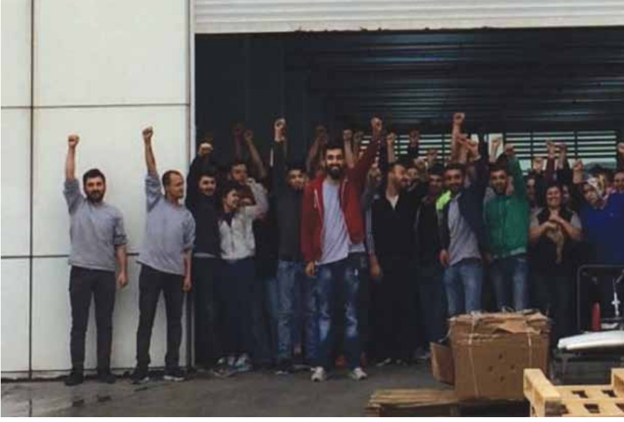
Diam işçileri direnişe devam ediyor

haklarda enflasyon oranında zam, c) Gece zammı yüzde 21,5, d) Grevde geçen bayram harçlığı ödenirken, Pazar hafta tatili ise korundu.