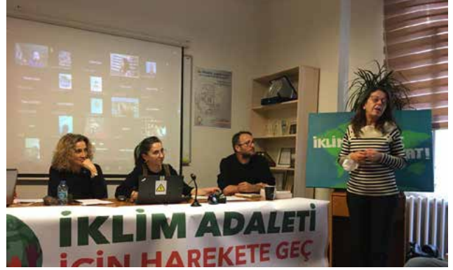
Basın toplantısında HDP milletvekili Oya Ersoy da söz aldı